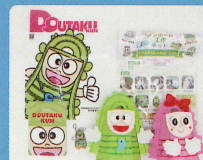
ドウタクくんグッズ