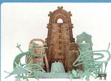
銅鐸関連商品 (青銅製)